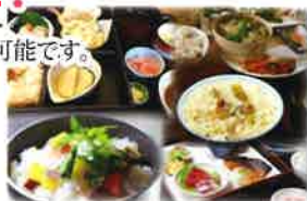
※食事写真は提供イメージになります

咀嚼、嚥下が困難な方のお食事対応が可能です。 糖尿病の食事対応もごさいます。 栄養士在中のため、栄養バランスの 採れたお食事を提供いたします。 また、毎月歳時に合わせ、イベント食事、 手作りおやつも実施致します。