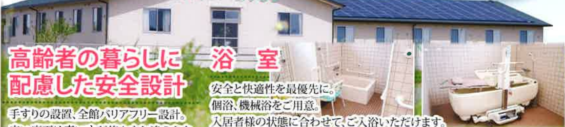
スマイル、あすなる